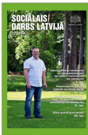
Sociālais Darbs Latvijā. Rīga : [Latvijas Republikas Labklājības ministrija].

Sociālais darbs -- Latvija. Sociālie darbinieki -- Latvija. Žurnāli.