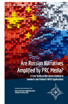
Are Russian Narratives Amplified by PRC Media? : a case study on narratives related to Sweden's and Finland's NATO applications. Riga : NATO Strategic Communications Centre of Excellence.

Plašsaziņas līdzekļi -- Politiskie aspekti -- Krievija. Plašsaziņas līdzekļi -- Politiskie aspekti -- Ķīna. Somija -- Starptautiskās attiecības -- Ķīna.