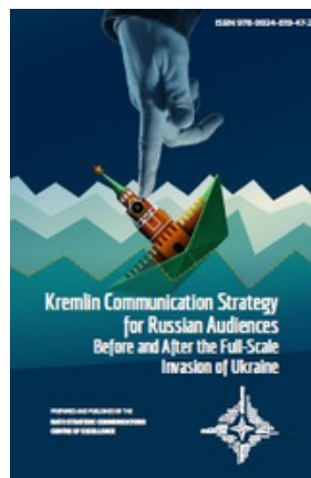
Kremlin Communication Strategy for Russian Audiences Before and After the Full-Scale Invasion of Ukraine. Riga : NATO Strategic Communications Centre of Excellence.

Krievijas-Ukrainas karš, 2022-. Krievu propaganda. Plašsaziņas līdzekļi un politika.