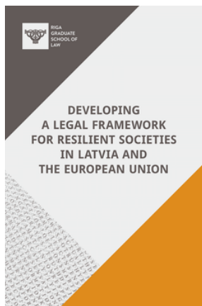
Developing a Legal Framework for Resilient Societies in Latvia and the European Union. Riga : [Riga Graduate School of Law].

Konstitucionālās tiesības. Viltus ziņu politiskie aspekti. Dezinformācijas politiskie aspekti.